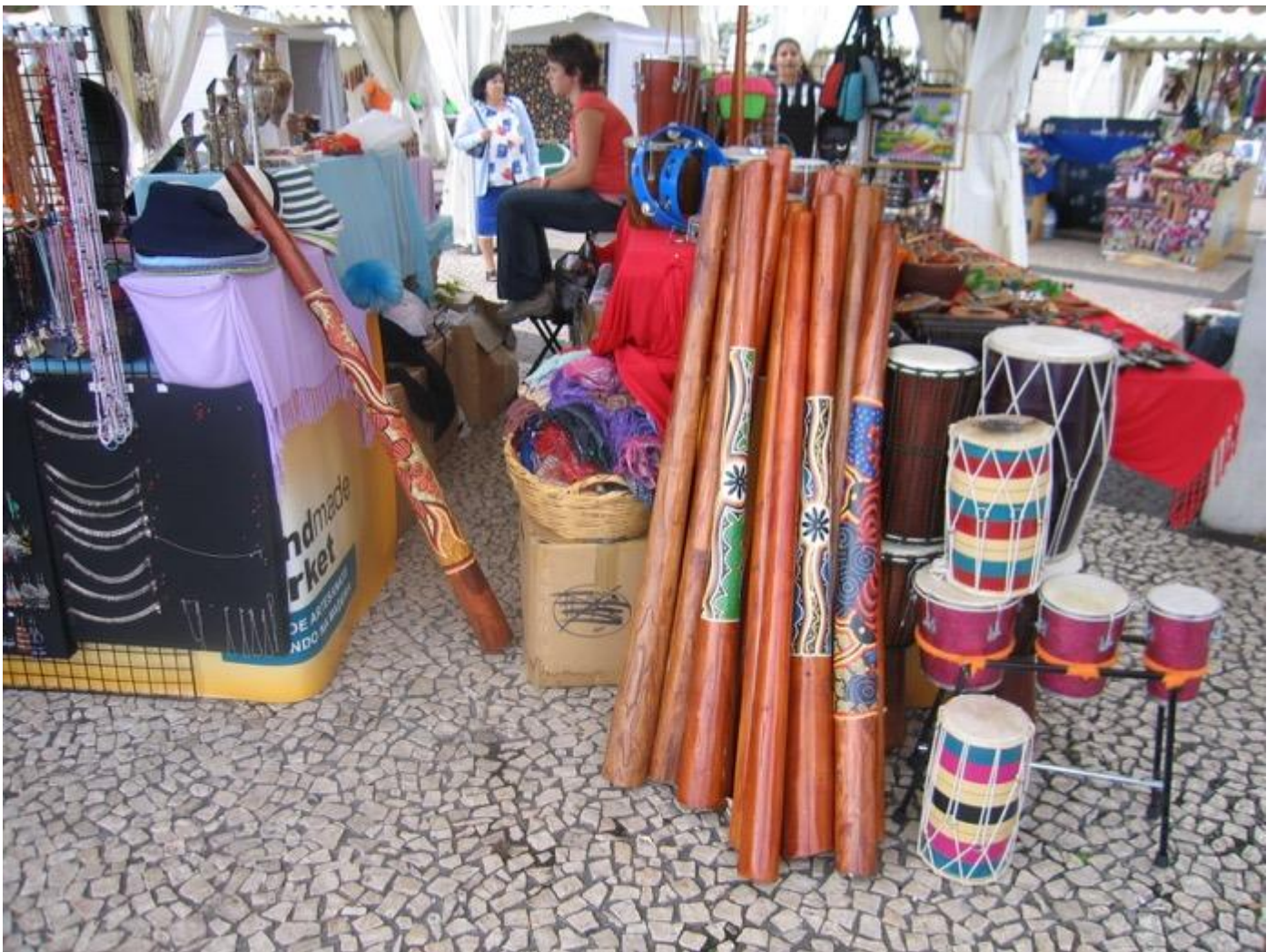
trovato al Brisa del Mar.