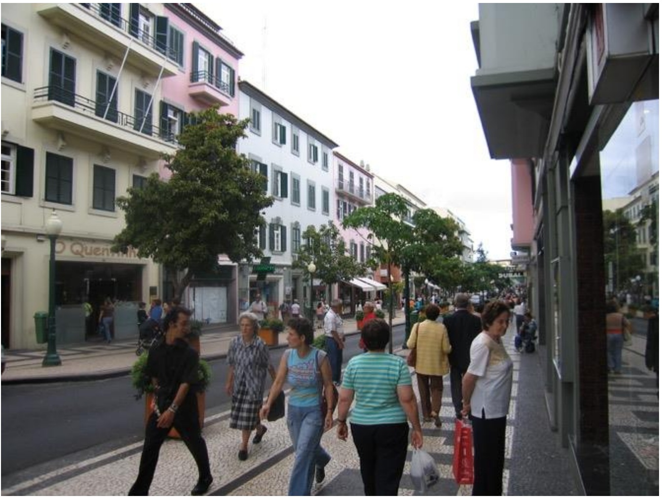
vuota, pieno di verdure e di fiori. Chiamano Di benedetto e Manigrasso. Tirano a rallentare.