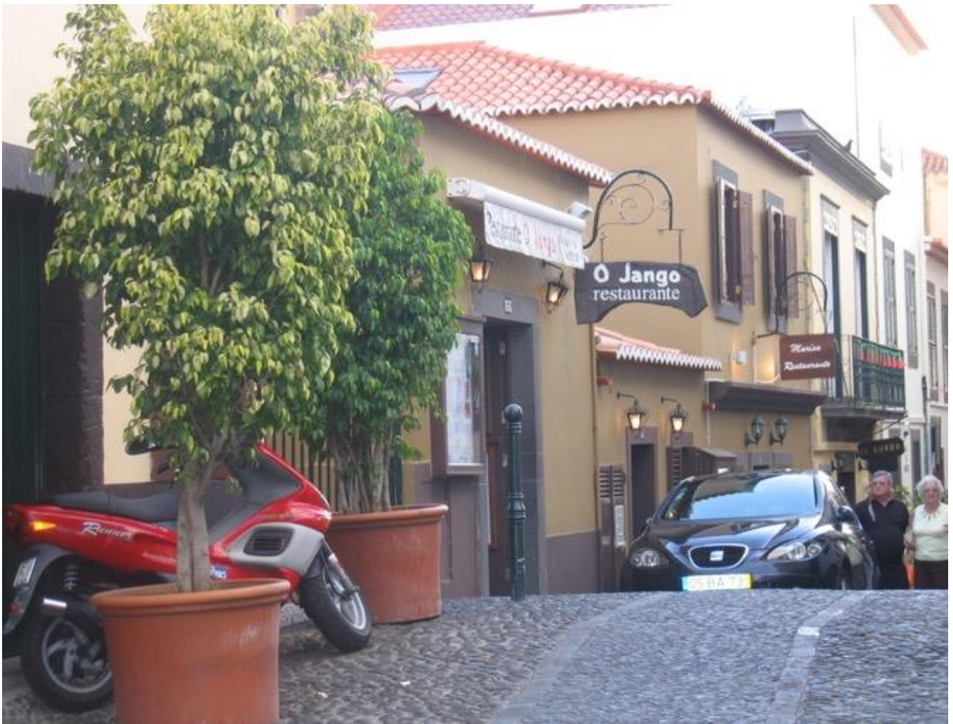
11 Giugno 2007 Funchal. Madeira.

Scendiamo a colazione verso le 10, ho fatto delle belle dormite. Poi si va in piscina. Si legge Bausi. Ombra e sole anche perché sono abbastanza rosso.